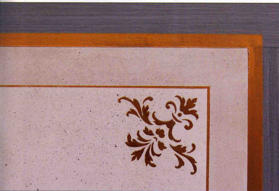
Photo 4 - Exemple : décor de patines Création de panneaux avec soubassements et cimaise. Une patine centrale à l'huile de ton gris, nuagée et spitée, des encadrements en patine filée acrylique de ton bleu et filets métallisés.

Pour en savoir plus sur le programme : http://www.ecoleartmural-versailles.com Ou Tél : 33 (0)1.39.51.83.72